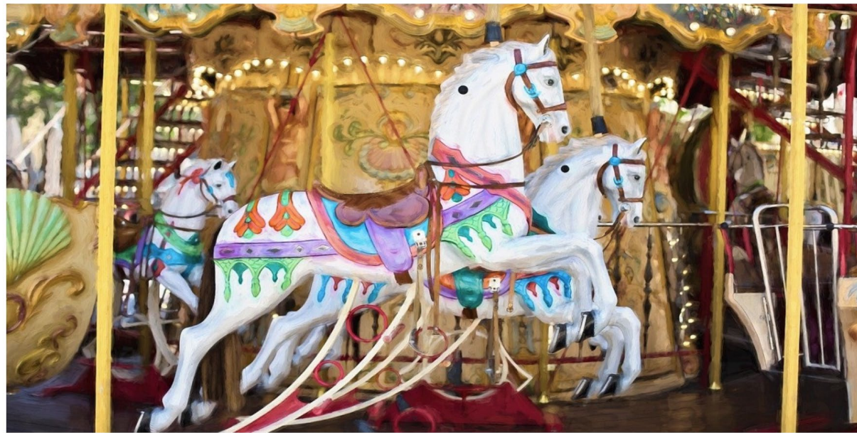
Abitur-Online für beruflich Reisende